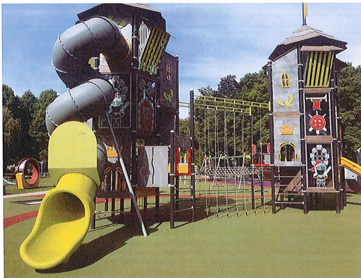
Nowo otwarty plac zabaw przy ul. Staszica w Krapkowicach zachęca dzieci do zabaw na świeżym powietrzu